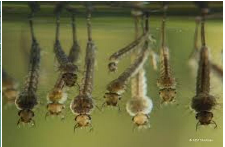
so lyk waterskerpioenlarwes

Hierdie soort gogga is 'n waterbesie en behoort aan die familie Nepidae . Hulle is nie giftig nie, maar as hulle bedreig voel, sal hulle knyp met hulle knypers, en dit kan seer wees. Hulle skerpioenagtige voorkoms laat lyk hulle gevaarliker as wat hulle is. Jy sal niks oorkom as jy dit op jou handpalm sit nie.