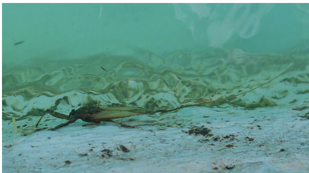
By waterbeweging vlug dit na die kant toe en sit stil daar hopende om nie gesien te word nie.

Interessant is ook, dat hulle 'n lagie lug onder hulle vlerke vir addisionele voorraad kan bêre. So is hulle in staat om redelik lank onder water te bly.