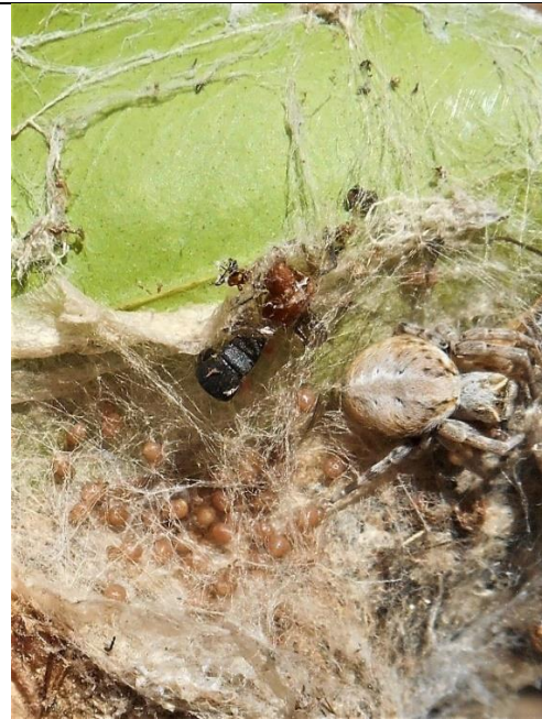
gekrimpte wyfie bewaak die nimfies in die nes

Blykbaar voer sy haarself aan haar kleintjies,, nadat sy haar binnegoed laat oplos. Die kleintjies prik haar agterlyf en suig dit uit en daarna gaan hulle versterk en vol lewensmoed die wêreld in..... inbegrip van moederliefde?