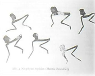
Boesmankinders speel Kaggen