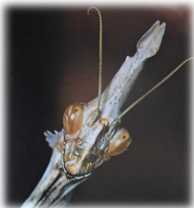
twee samegestelde oe plus drie punt-oe (ocelli)

In Afrika asook in Europa bestaan vandag nog die geloof, dat die mantis vir jou die regte rigting kan aandui (met die kop of een "arm"), as jy die pad bystergeraak het. Verder word geglo, hulle wys die rigting vir 'n prooi as jagters vleis soek. As jy die diertjie sien, vra jy vir hom en dan gee dit die teken met die "arm" of draai die kop (Mantids kan hulle kop draai en op en af beweeg, buitengewoon vir 'n insek)