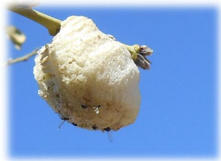
skuimpakkie van 'n hotnotsgod

Die hotnotsgod is inderdaad een van die merkwaardigste "goggas", waarmee die Skepping vorendag gekom het, en dit wys eintlik vir ons die veelvoud van die natuur EN hoe die mens daarop reageer. In die sewentigerjare is daar selfs 'n balletopvoering met die naam "Mantis Moon" in Windhoek op die planke gebring; die komponis van die musiek, ene Hans Maske, Duits-gebore "Suidwester", die storie gebaseer op 'n Boesman-legende. ( Die hotnotsgod jag ook in die nag, word deur lig aangetrek. Die ballet is slegs eenkeer op die planke gebring....ek het dit gesien, ek was BAIE be-indruk destyds).