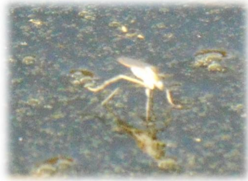
'n ander soort watervlieg

Daar is BAIE, BAIE soorte van hierdie muggies, moeilik om te identifiseer (of af te neem) omdat hulle so rusteloos en vinnig op die water heen- en weer-naelloop. Die bene is baie lank, vlerke eintlik korterig, die mannetjies se antennae is sterk geveer.