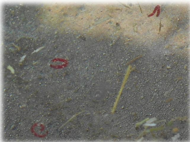
Bloedwurms wei in die modder

Die larwes van verskillende soorte muggies is nie almal rooi nie, hulle kan ook gelerig of groenerig wees. Die rooies bevat hemoglobien (dit maak ook ons bloed rooi), wat hulle in staat stel om die nodige suurstof uit die modder beter te kan opneem.