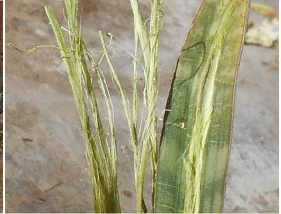
vesels nadat vog en vel afgekrap is