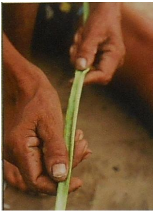
verwerking van blaar na vesel