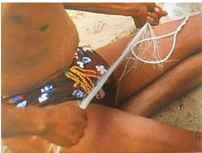
...en dan na tou