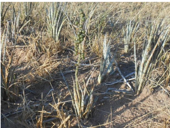
Sansevieria aethiopica met vrugte wat later oranje verkleur

Blare of die risome wat gekook is, kan teen aambeie, maagsere en inwendige parasiete verligting bring, as jy dit kou. Dit het 'n anti-inflammatoriese werking (wetenskaplik bewys!)