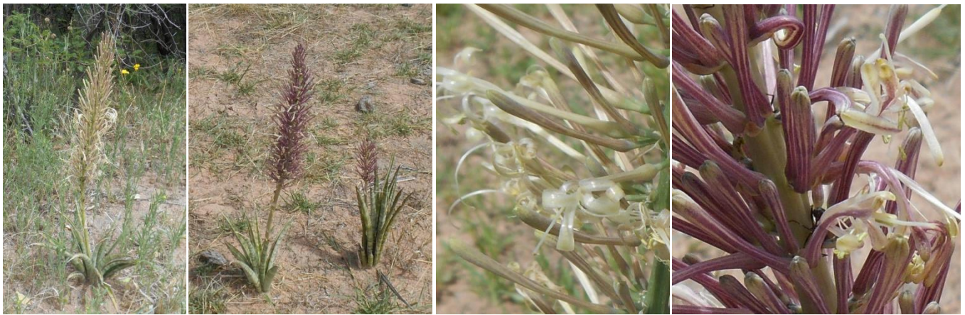
Sansevieria aethiopica met witterige blom

Hier by ons in die veld kom eintlik slegs die Sansevieria aethiopica en Sansevieria pearsonii voor; dis diegene met die smal blare, en soos ons kan verwag, die breëblaarspesies in die ooste van die kontinent waar dit meer reën.