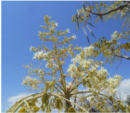
blomtros kroon die boompie