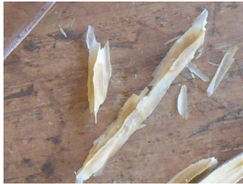
Moringa sade is driehoekig

Van die Moringa ovalifolia is geen medisinale waarde bekend nie , alhoewel in slegte tye van die wortels genuttig is deur inheemse bevolkingsgroepe.