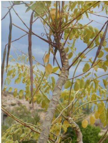
Moringa ovalifolia met ryp peule...

Van die Moringa ovalifolia is geen medisinale waarde bekend nie , alhoewel in slegte tye van die wortels genuttig is deur inheemse bevolkingsgroepe.