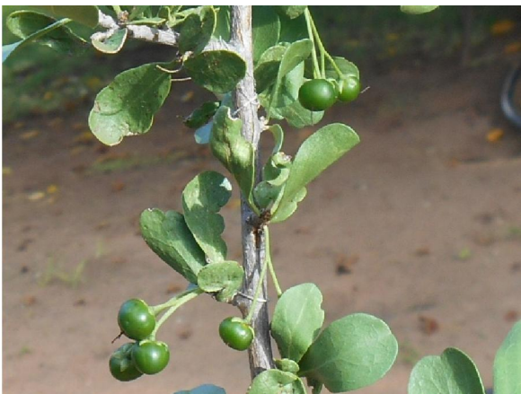
groen bessies en blare

Elke jaar verheug ek my opnuut in hierdie nietige en gewoonlik onooglike struik, as dit skielik in volle blom staan, waar al die ander struie en bosse nog vaal en dood lyk. So lok dit dan ook talle insekte aan, wat na die winter lus is vir vars nektaar- en blaarkos.