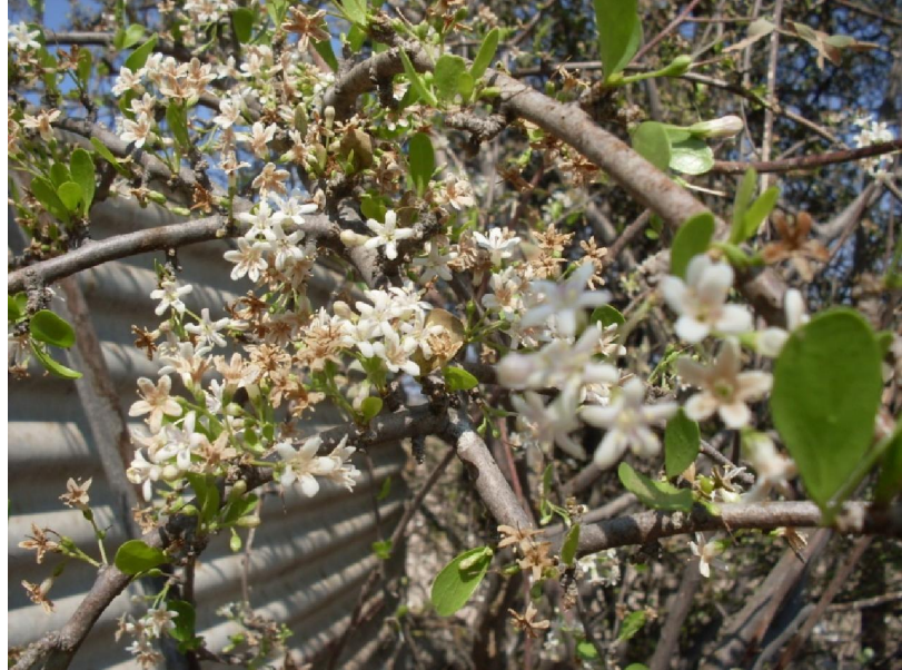
Ehretia alba vars blommetjies is wit, oueres vuilwit

Elke jaar verheug ek my opnuut in hierdie nietige en gewoonlik onooglike struik, as dit skielik in volle blom staan, waar al die ander struie en bosse nog vaal en dood lyk. So lok dit dan ook talle insekte aan, wat na die winter lus is vir vars nektaar- en blaarkos.