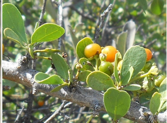
ryp bessies lyk oranjekeurig