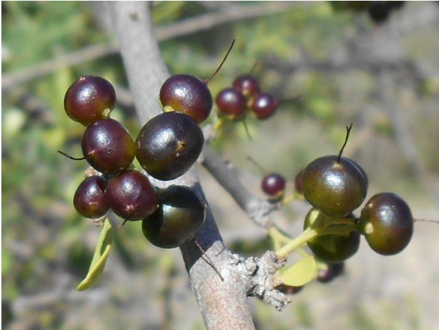
Die bessies van party struik lyk tussen die groen en oranje stadium swart.