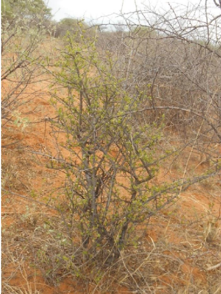
Ehretia alba struik