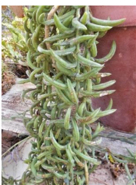
String of bananas

dikte van 'n stingel in die tuin en die ene in die veld winter. Die veldstingel is duidelik geriffel en die groeipunt voor bevat meer vloeistof as die ou stingel. tuinstingel is vet en rond sonder riffsels. sjambokbossie kan maklik uit steggies gekweek word. eers wortel geskiet het, het dit maar min water nodig. Voordelig is, dat die plant nie woes vermeerder en die vervuil nie ten spyte daarvan dat dit baie saad produseer