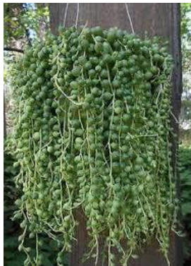
String of pearls